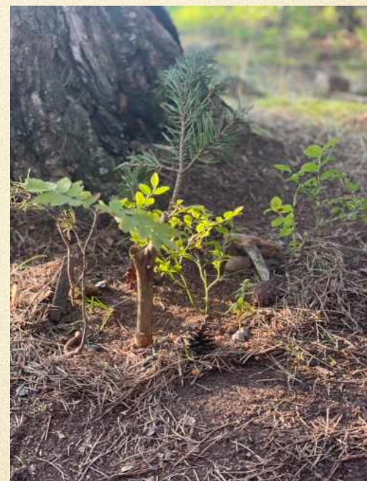
kuu: Metsä / The Forest