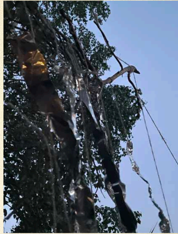
Kerkkä: Heijastus / Reflection

For me one of the greatest gifts of the Piennaali was that thrill that came every time a new piece was ready to be shown. To see, hear and feel someone else's thought and creativity — how an idea had been shaped and a personal experience translated into form. And likewise, the thrill of sharing one's own idea, carefully constructed piece or spontaneous impulse with others. Like a child saying: "Come see what I made!"