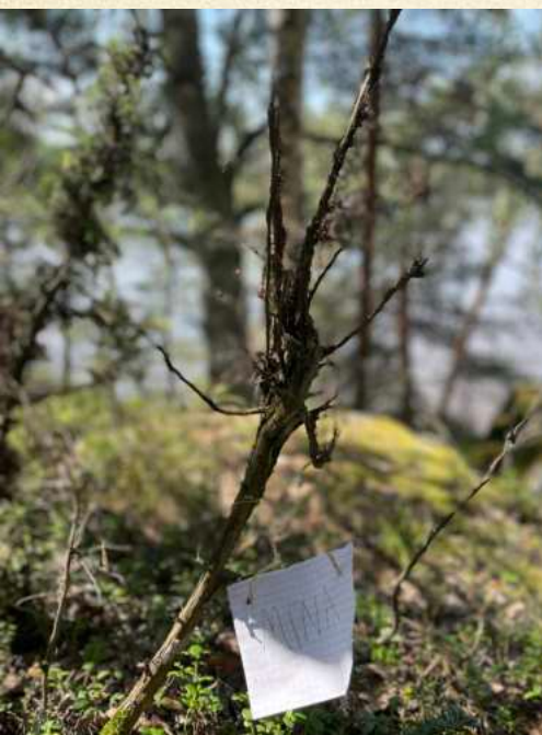
eemeli: Näe minutkin! / See Me Too!