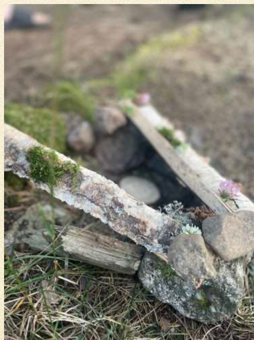
kuu: Linna / The Castle