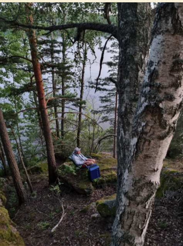
eemeli: Vihdoinkin Pariisiin / Finally to Paris