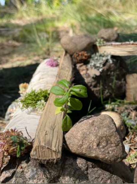
kuu: Linna / The Castle

Yksi piennaalin suurimmista lahjoista itselleni oli se kutkutus, joka syntyi joka kerta, kun uusi teos oli valmis esiteltäväksi. Kun sai nähdä, kuulla ja kokea toisen ajattelua ja luovuutta: miten joku toinen oli jäsentänyt idean, kiteyttänyt jotain omasta sisäisestä kokemuksestaan näkyväksi. Ja toisaalta myös se kutkutus, joka syntyi, kun