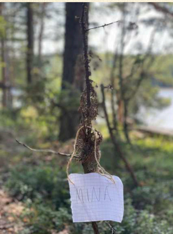
eemeli: Näe minutkin! / See Me Too!

Taide oli piennaalissa yhteinen leikki – tila, jossa ei ollut oikeaa tai väärää, vain mahdollisuus kysyä: ”Voiskohan tehdä teoksen, joka...” Moni teos sai alkunsa hetkellisestä oivalluksesta tai hiljaisesta havainnosta, toiset puolestaan vaativat enemmän suunnittelua ja toteutusta. Mukana oli sekä yksin luotuja pohdintoja että yhdessä rakennettuja ja osallistavia kokemuksia.