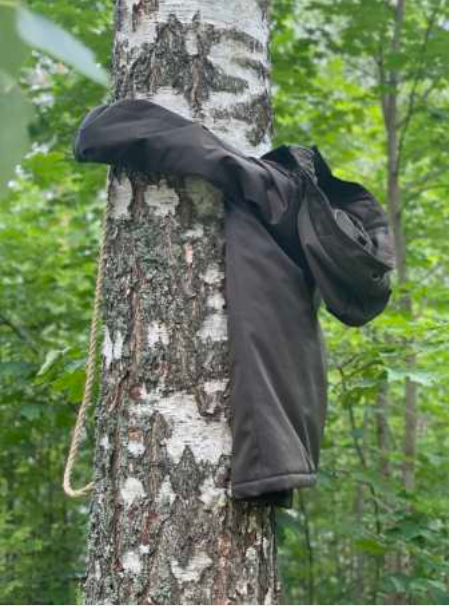
Kiki Crow: Nonbody