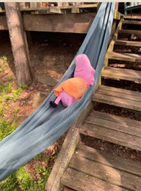
Lyyli Suomalainen: The Third Child – Comeback

At times, artists treaded the slippery slope of parody — playing seriously and taking play seriously. Sometimes they walked beneath the lowest bar of the fence; at other times, they reached ambitiously toward the sky. As a viewer, it wasn't always clear how to respond: Was it okay to laugh? Was one meant to fall silent? Was the piece inviting participation, or was it simply to be witnessed? Could the work be taken lightly, and was one allowed to throw sticks into the water too?