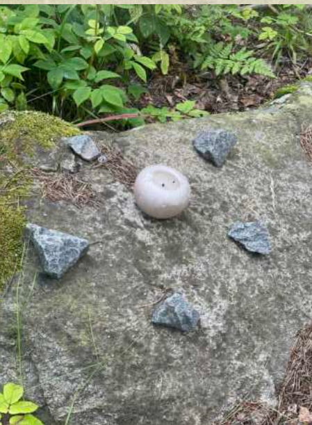
Detail of "sabbath hangout" by Cerfeuill

Installaatio puun juurella. Keppejä, oksia, varpuja, kiviä, käpyjä. An installation at the base of a tree. Sticks, twigs, moss, stones, cones.