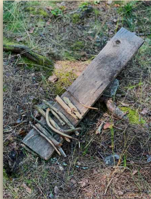
Työryhmä: 10 "sticks" on a board