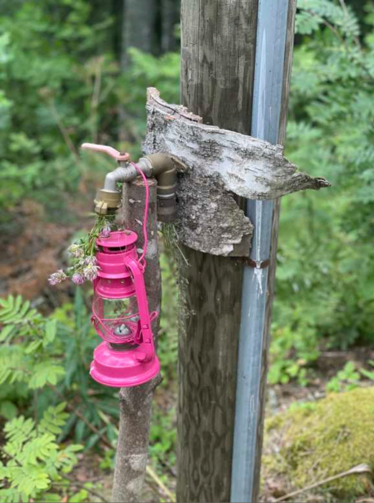
Iisakki: The Canvas of Human Life

Kokijana ei aina tiennyt, miten teokseen tulisi suhtautua: oliko sopivaa nauraa, saiko hiljentyä, oliko tarkoitus osallistua tai kenties vain katsoa sivusta. Voiko teosta tulkita kevyesti, entä saiko itsekin heittää keppejä veteen?