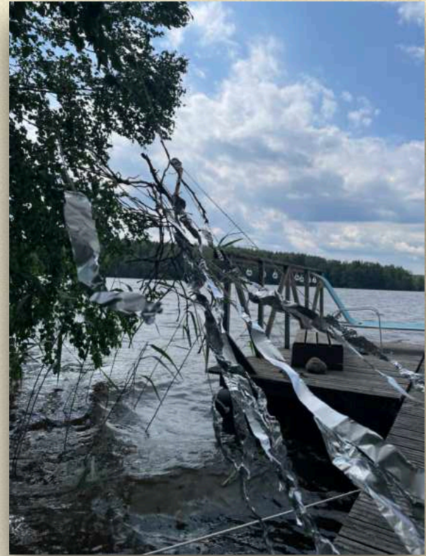
Kerkkä: Heijastus / Reflection

21.7.2025 Pässinnokalla Ilja Eemeli Mäkelä