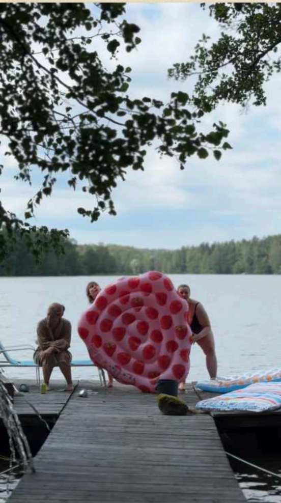
Kapitalistisika: Paratiisi / Paradise

Piennaalissa taidetta ei synnytetty tyhjästä, vaan osallistujat saattoivat tarttua erilaisiin tehtävänantoihin kolmesta pääkategoriasta: visuaalinen taide ,