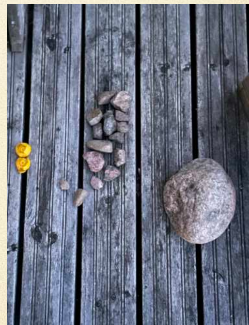
Kerkkä: Heijastus / Reflection