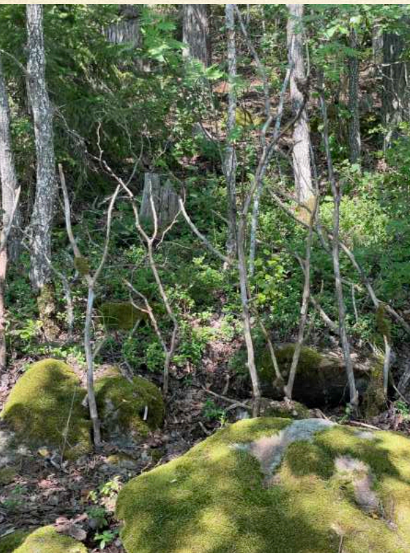
eemeli: Näe minutkin! / See Me Too! (part of the temple)

Not all works were photographed, and not every moment was documented. Some experiences were intimate, unfolding without outside observers. In some cases, photos were only captured after the presentation. Not all creative processes reached completion during the festival — some may evolve